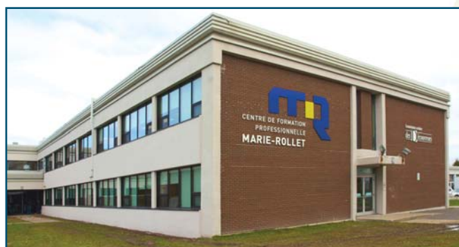
Le CFP Marie-Rollet