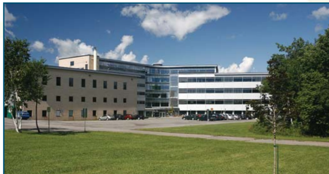
Le CFP Maurice-Barbeau

Le CFP Marie-Rollet est particulièrement apprécié pour ses formules d'enseignement flexibles et son service d'aide à l'emploi dynamique, toujours à l'affût des opportunités d'emplois.