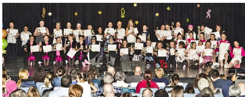
Concours Mini Stars 2018