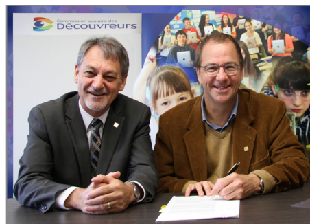
Le directeur général et le président lors de la signature pour la construction du Complexe sportif de l'école secondaire De Rochebelle

Nous en sommes grandement reconnaissants. À chacune et à chacun, nos plus sincères remerciements.